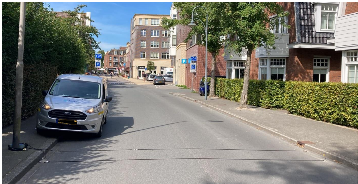
Afbeelding 2: voorbeeld telsysteem